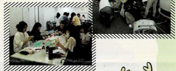
R7年度開催時の様子