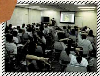
R7年度開催時の様子