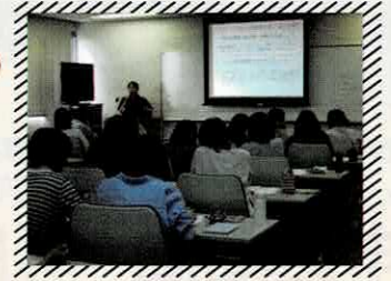
R7年度開催時の様子

普段子どもを支援していく中で、子どもの個性を引き出すヒントや関わり方をお伝えします。ワークシートを通して、子どもの行動を整理しましょう！