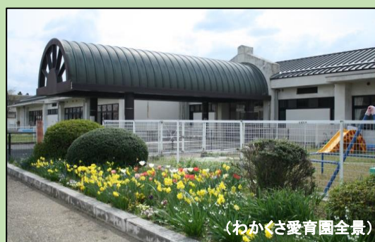
(わかくさ愛育園全景)

近鉄田原本駅... タクシー 約10分 近鉄大和八木駅... タクシー 約15分 近鉄大和八木駅... 無料送迎バス 約15分