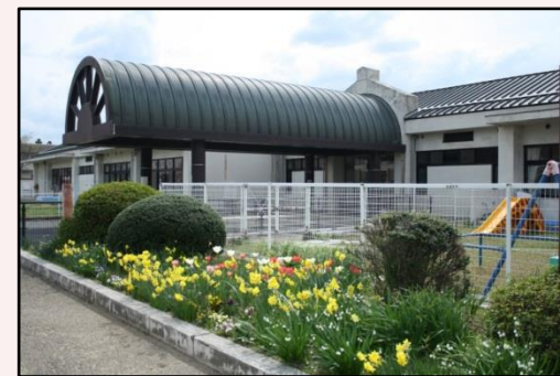
奈良県障害者総合支援センター わかくさ愛育園

児童発達支援センター わかくさ愛育園では、保育所や幼稚園などに通う子どもさんが、集団での生活や適応に専門的な支援が必要な場合に、支援を行う保育所等訪問支援事業を行っています。是非、ご利用についてご相談ください。